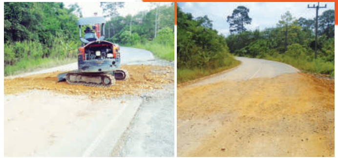
โครงการซ่อมแซมถนนถมหลุมบ่อ ถนนสายประปา 2