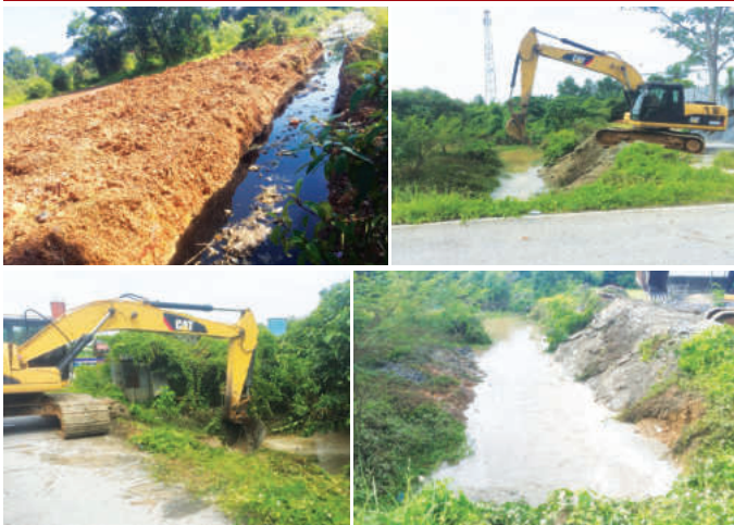
بودลอกครุระบายน้ำภายในเขตเทศบาลตำบลท่ายาง